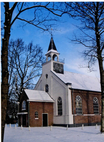
De Gereformeerde Kerk van Berghuizen-Ruinerwold.