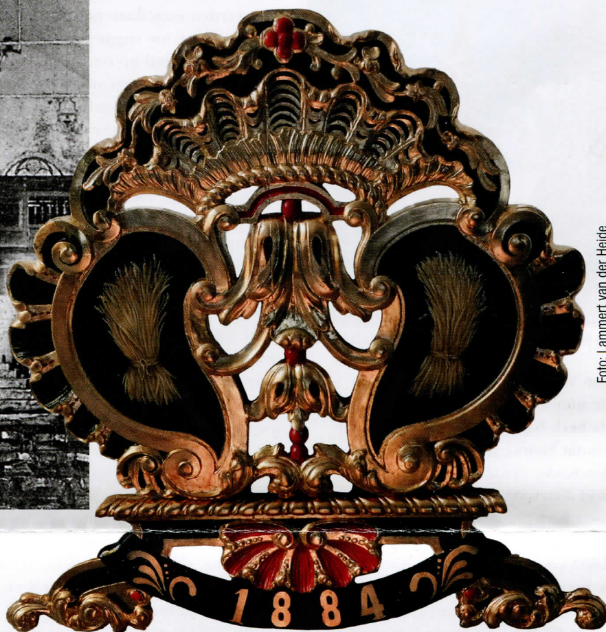
Het gerestaureerde schild.