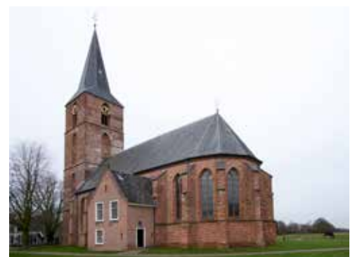
De kerk van Rolde gezien vanuit het zuidoosten. De aanbouw werd gerealiseerd in de jaren 1961-1964 toen de kerk werd gerestaureerd en zoveel mogelijk werd teruggebracht naar de toestand van vóór 1854.