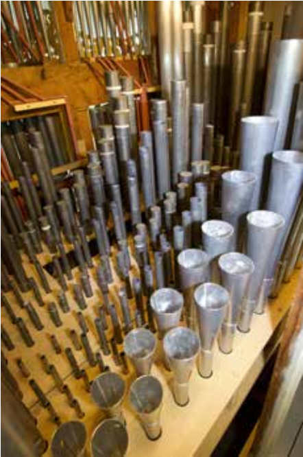
Inkijk in het hoofdwerk. Het pijpwerk staat in torens opgesteld en vanaf d vanuit het midden aflopend.

pijpen spraken niet of nauwelijks aan en er waren steeds ontstemmingen.