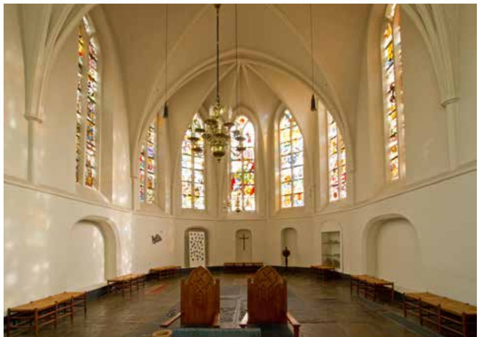
In de acht koorvensters werden door Joep Nicolas tussen 1964 en 1968 fraaie gebrandschilderde ramen gemaakt. De afbeeldingen hebben te maken met het feit dat het koor tot 1688 werd gebruikt als zetel van het Rolderdingspel, de eststoel. De zes Drentse dingspelen vergaderden tweemaal per jaar te Rolde; de derde keer was altijd in Anloo.