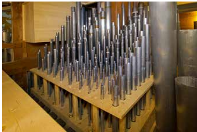
Pijpwerk van het bovenwerk. Links, met nieuw hout, de dakaanvulling die ter sprake kwam bij de detailfoto van de bovenste tussenvelden. Rechts bekers van de Trompet 8 vt van het hoofdwerk.