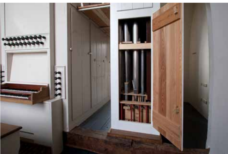
Het nieuwe pedaal in een nieuw onderkomen. De enige oorspronkelijk stem is de Octaaf 4 vt die in 1955 werd uitgebreid van C-f naar C-d 1 .

mogelijk de toestand van 1847 te 'recreëren', met nu de kans tot een verantwoorde uitbreiding die meer gelijk op de gegroeide situatie. Het project kon van rijkswege worden ondersteund omdat het instrument weer op de veilige lijst was teruggekeerd. Als eerste fase werden in 2001-2002 door Mense Ruiter de laden van het hoofdwerk gerestaureerd. Er kwam een nieuwe spaanbalg, naar voorbeeld van het Honhof-orgel (1865) te Haaksbergen. Deze kwam in een nieuwe behuizing aan de zuidkant van de orgelgalerij. De windkanalen, windmachine en dempkist werden eveneens nieuw gemaakt. Bij de tweede fase (2009) en de voltooiing van de totale restauratie (2012) kwam een nieuw vrij pedaal, waarvan nog slechts één stem – de Octaaf 4 vt – deels oorspronkelijk was. Voor (weer) een nieuw pedaalonderkomen moest er op de galerij worden gewoekerd met de ruimte. Om toch een bevredigend resultaat te krijgen, werd de scheidingswand tussen toren en kerk richting toren verplaatst. Er kwam een tweede spaanbalg. Het oorspronkelijke klavier – door organist Zwerver gelukkig nog bewaard – werd weer aangebracht, met wegneming van delen uit 1955; het pedaalklavier en de toets- en registermechaniek van alle werken werden gereconstrueerd naar 1847. Helmer Hut uit Beerta schilderde nieuwe registeropschriften. De dispositie van het hoofdwerk werd als weleer. De Prestant 16 vt disc.