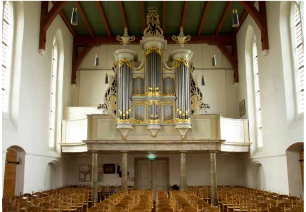
Het orgel, in 1847 geplaatst, in de Protestantse Jacobuskerk te Rolde.

Het mooie Drenthe met zijn 52 hunebedden heeft er weer een kei van een orgel bij!