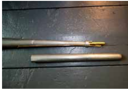
Een pijp van de nieuwe Trompet 8 vt van de lade en daarna uit zijn stevel gelicht.

In het boekje over het orgel zegt Tuinstra: “De klank van het orgel is, conform de post-Westfaalse stijl rond 1800, ontspannen en melancholiek zingend met geprononceerde aanspraak in de prestantregisters, helder en verfijnd in de fluiten en krachtig, helder en enigszins ruisend bij de tongwerken en in het tutti.” Bert Jan van der Weerd van Mense Ruiter Orgelmakers had het bij de ingebruikneming over het bijzondere (klank)karakter: “De prestanten hebben bijna fluitmensuur, de