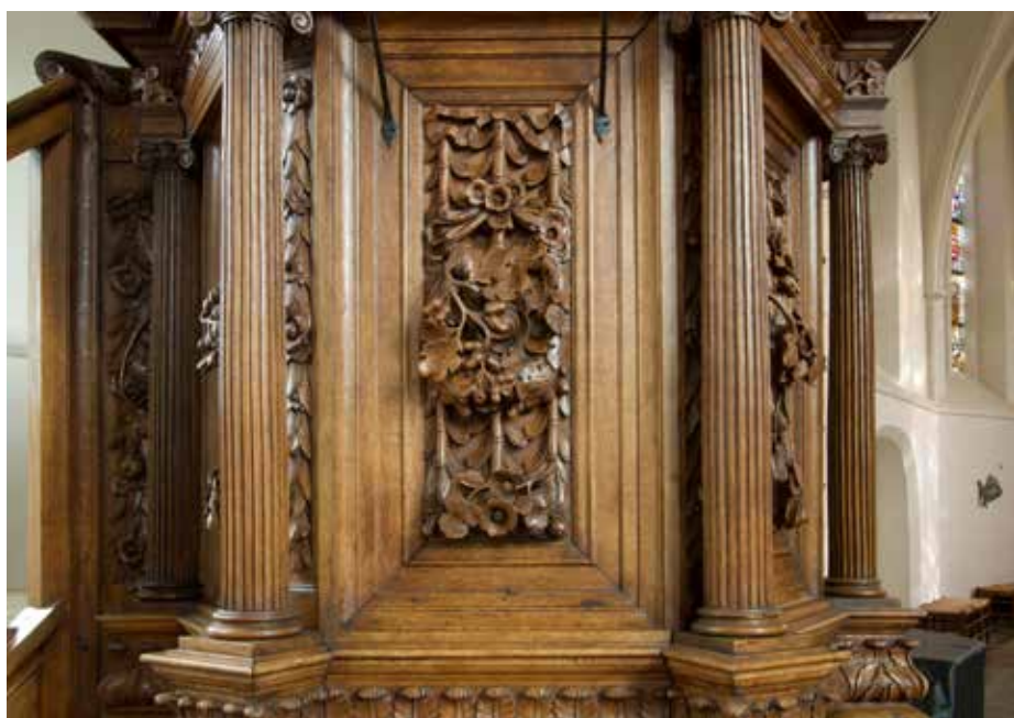
De panelen van de kansel uit 1677 zijn zeer kunstig gesneden; elk paneel laat een andere uitgebeelde boomsoort zien.

vernieuwd. Er kwam nieuw snijwerk in Noord-Duitse barokachtige stijl bij de voeten van de frontpijpen. Een opvallend ornament verdween van het orgeltoneel, het stond al aangekondigd in Leefflans offerte uit 1953: " Het verwijderen van de adelaar en aanbrengen van een nieuwe console in aansluitende stijl onder de middentoren en kost F. 75,- ". Sinds 1955 hangt het trotse dier aan de zuidmuur genageld, werkeloos. De orgelkast, tot dan in een donkere hout-imitatie-beschildering, werd nu Pruisisch blauw.