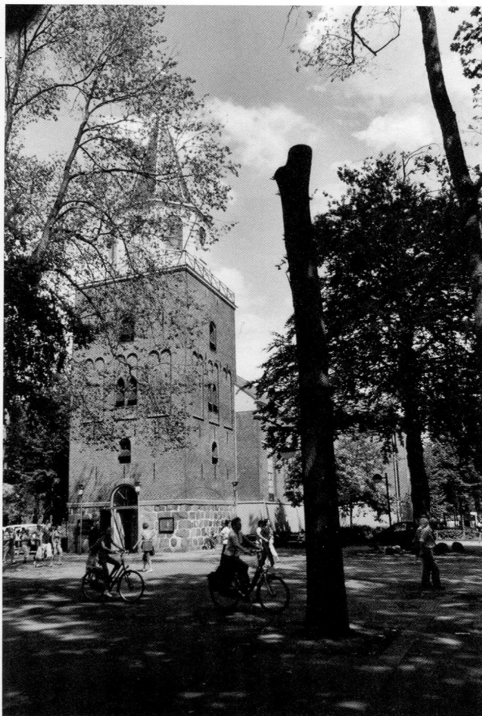
De Grote Kerk uit 1856 met de van oorsprong twaalfde-eeuwse toren. Het achtkantige bovendeele met spits is uit 1855.

en strijkers. Ook de tongwerken van HW en Pedaal zijn enerzijds gebaseerd op Meijers mensuren en makelij, maar zijn anderzijds in klassieke zin geïntoneerd.”