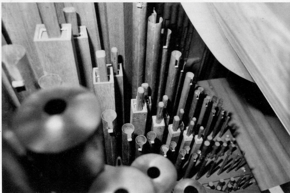
Een blik in het bovenwerk, met op de voorgrond de gereconstrueerde Fagot-Hobo.