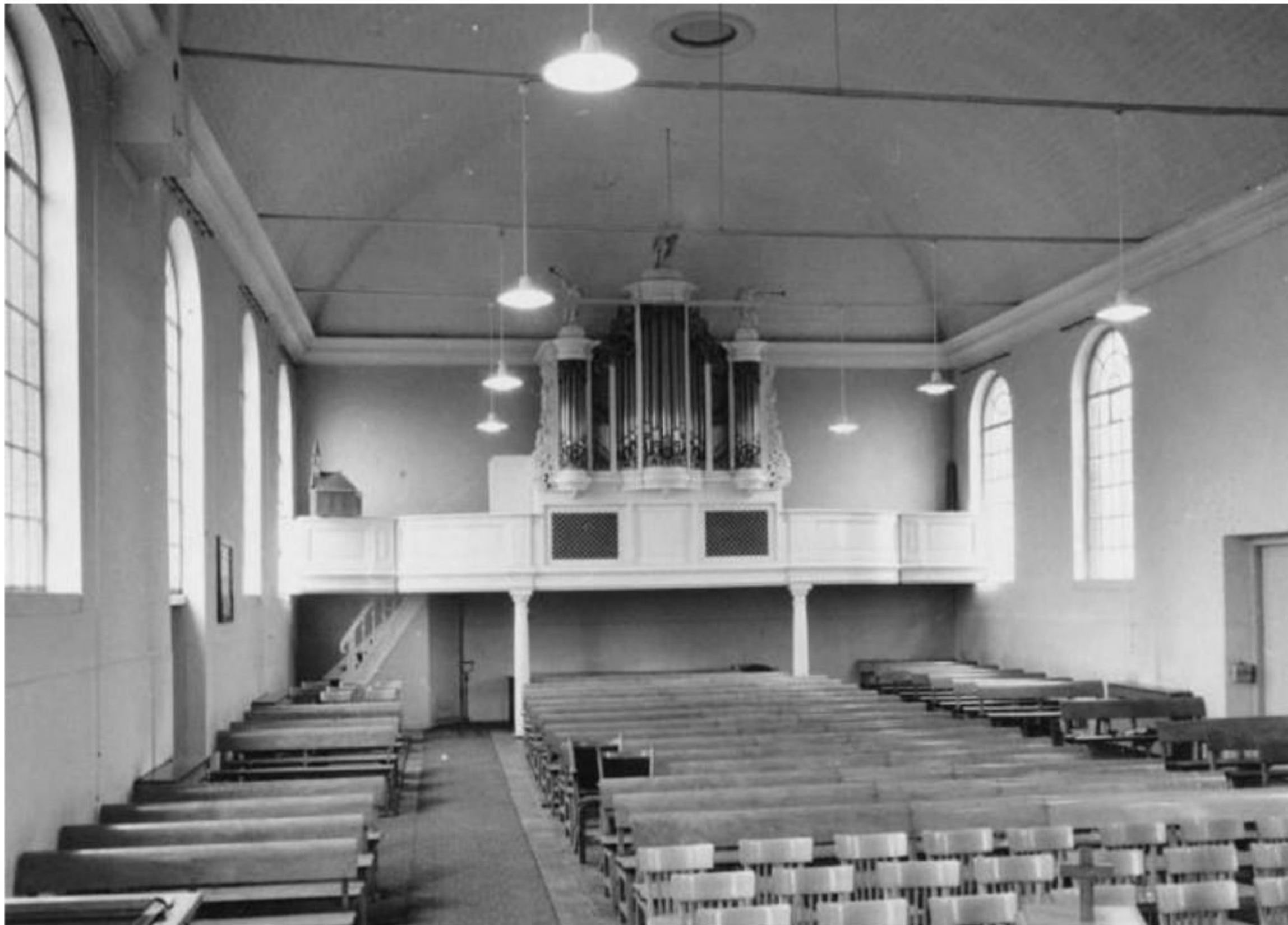
Orgel en interieur van de kerk na 1954