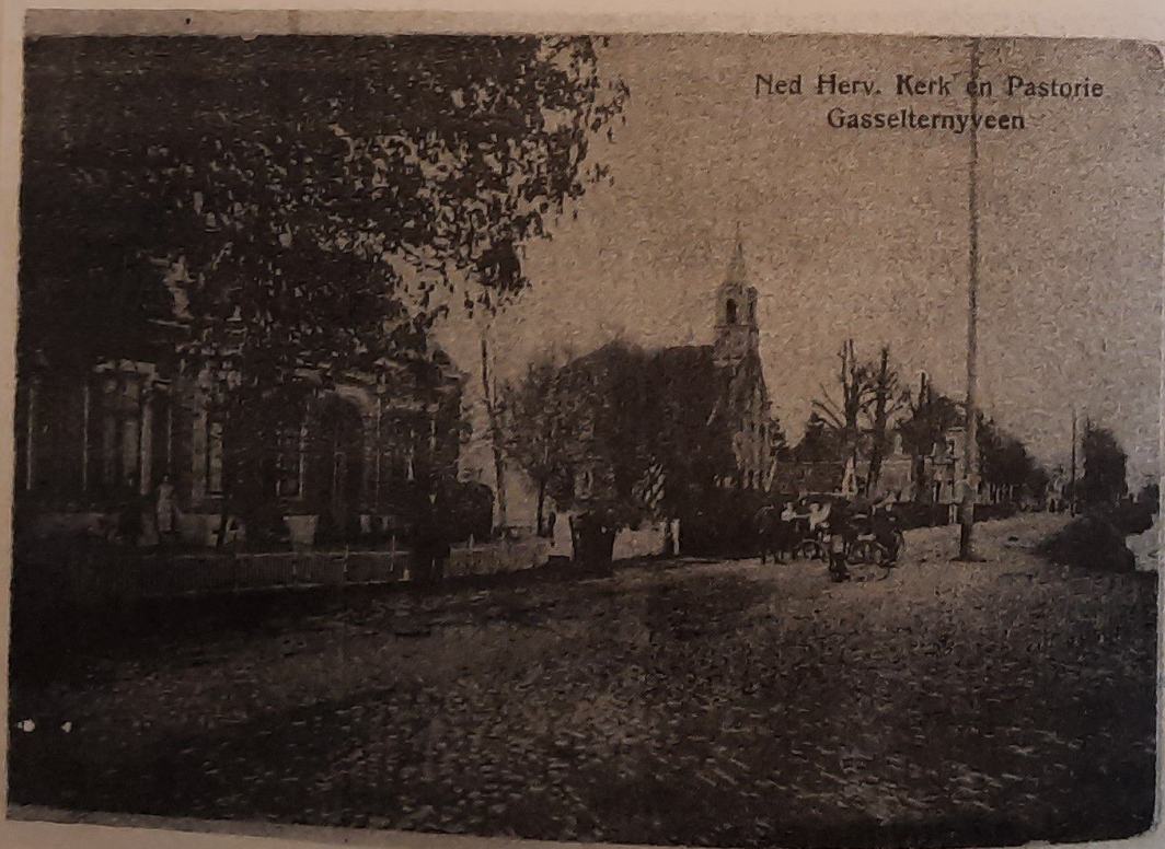
Ned. Herv. Kerk en Pastorie Gasselternijveen