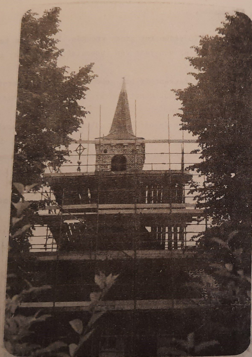
"in de steigers"