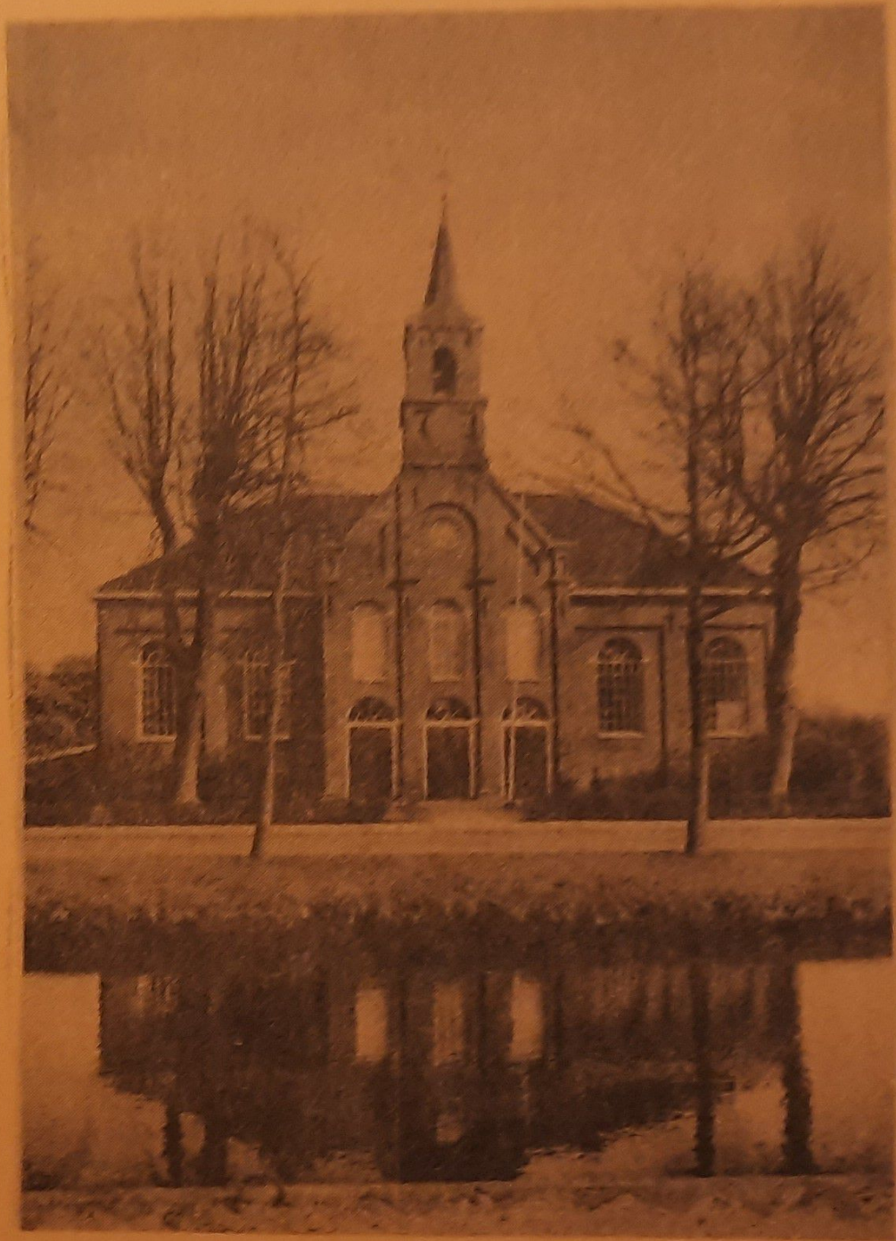
ned. herv. kerk gasselternijveen