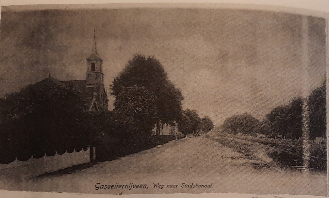
Gasselternijveen, Weg naar Stadskanaal.

Aanvankelijk stond bij de in 1859 in gebruik genomen kerk, de toren er niet vóór, als thans, doch er bovenop. Het bleek echter dat het gewelf dit op den duur niet kon dragen. In 1879 werd tot afbreken van dien toren en het bouwen van een nieuwe er voor besloten. Dit werd op 29 Maart 1879 door Kerkvoogden en Notabelen uitbesteed voor f 1837, zonder de metselsteen, die blijkbaar onderhands was aangekocht, of mogelijk ook was geschonken. Ter vergelijking van de loonen van thans, vermelden we nog dat als tariefsprijzen werd berekend als uurloon voor een timmerman 17 ct., voor een stucadoor en steenhouwer 25 ct. en voor een opperman 11 cent per uur.