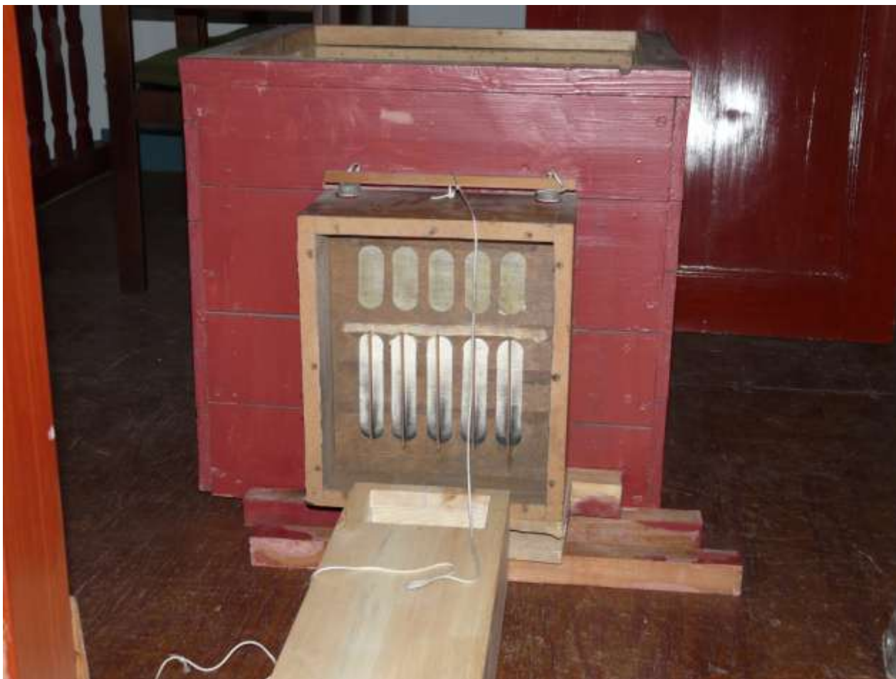
Een kijkje in de (oude) reguleurkast