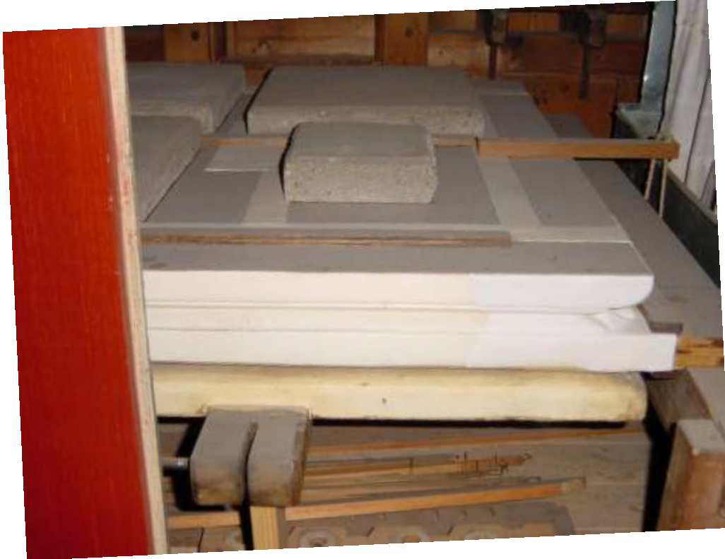
Gewone tegels voor het instellen van de winddruk