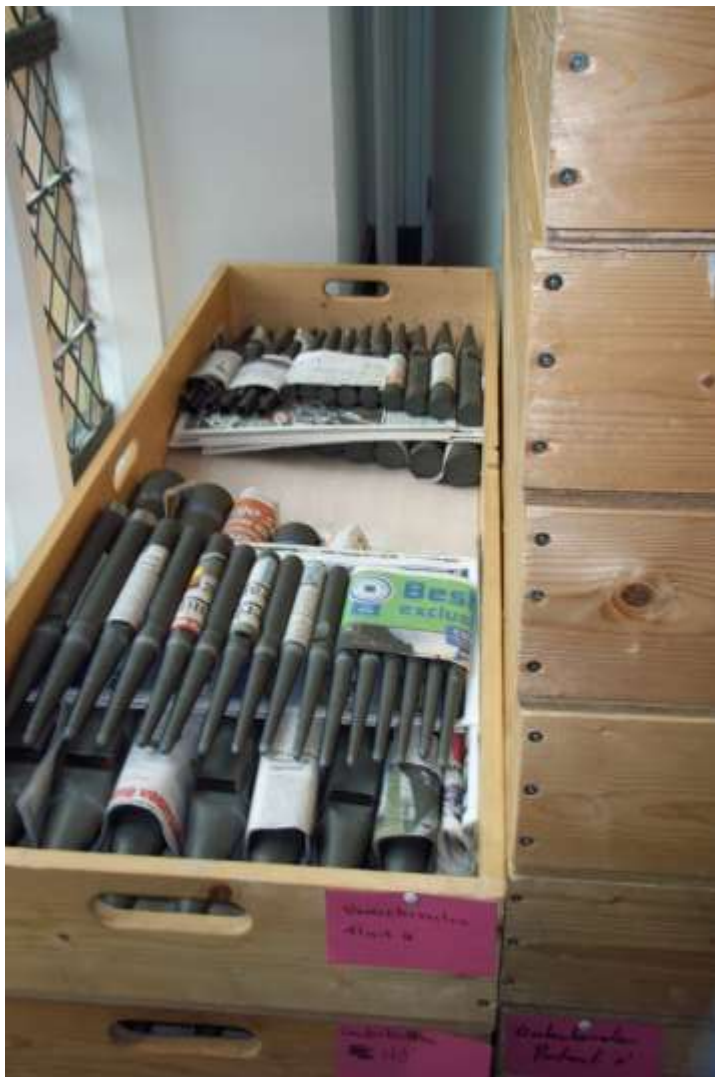
Inpakken: op naar de werkplaats