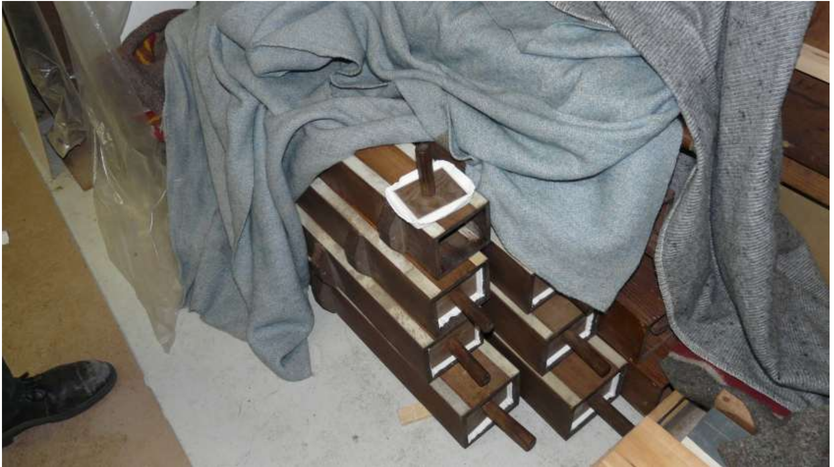
Houten pijpen afgeplakt i.v.m. voorkomen van lekkage en de stop met nieuw leer