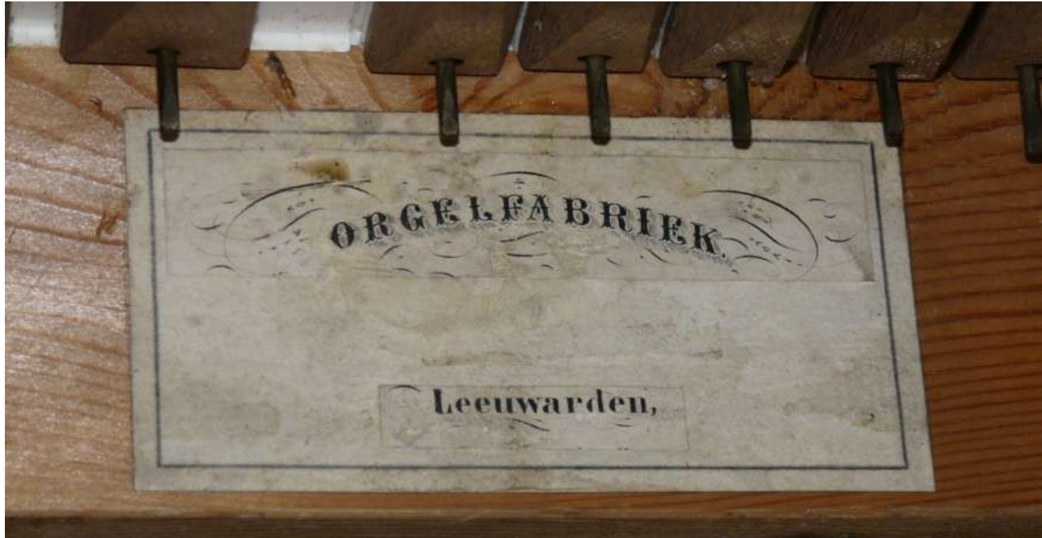
'Plakplaatje' in de ventielkast