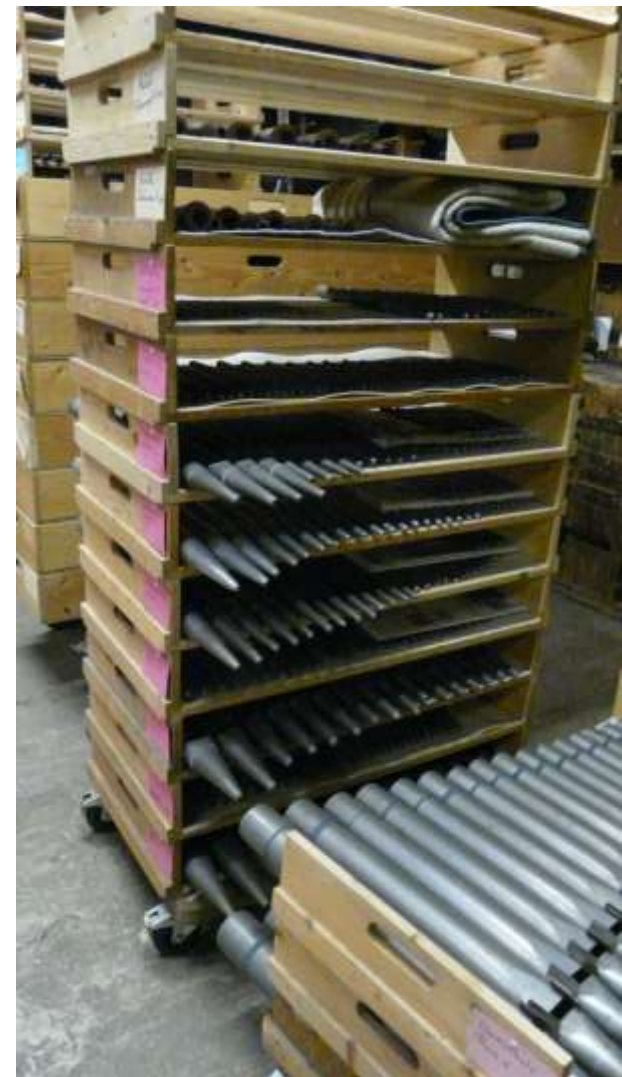
In afwachting op de vakman