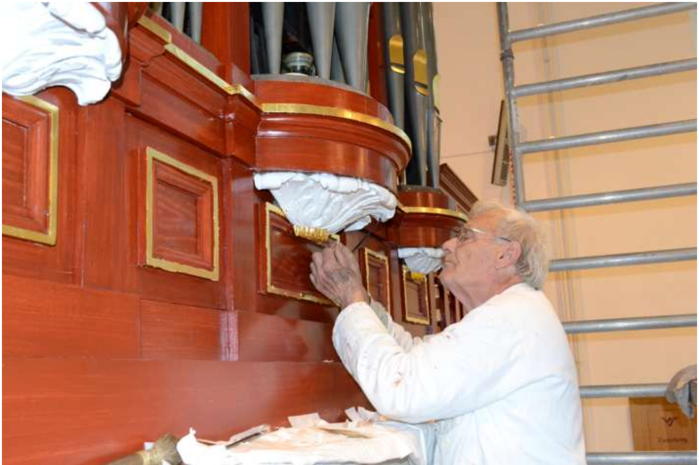
De consoles en de biezen moesten ter plekke worden bewerkt