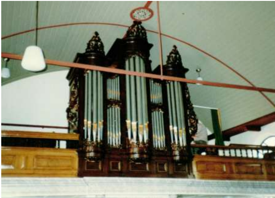
Het orgel in Wyckel