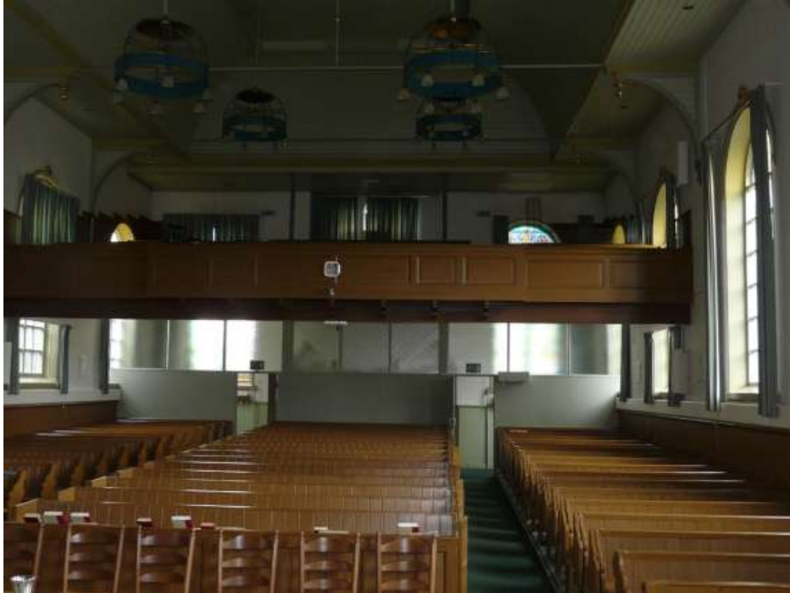
Hier stond 'ons' Van Dam orgel