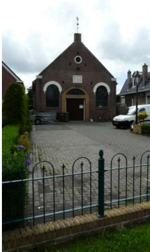
De (voormalige) Gereformeerde kerk te Wyckel