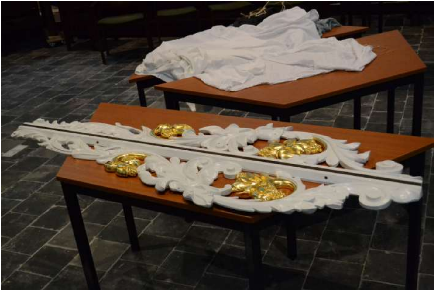
Het snijwerk voor de zijkanten: ingekort in 1983 i.v.m. de hoogte van de balustrade.