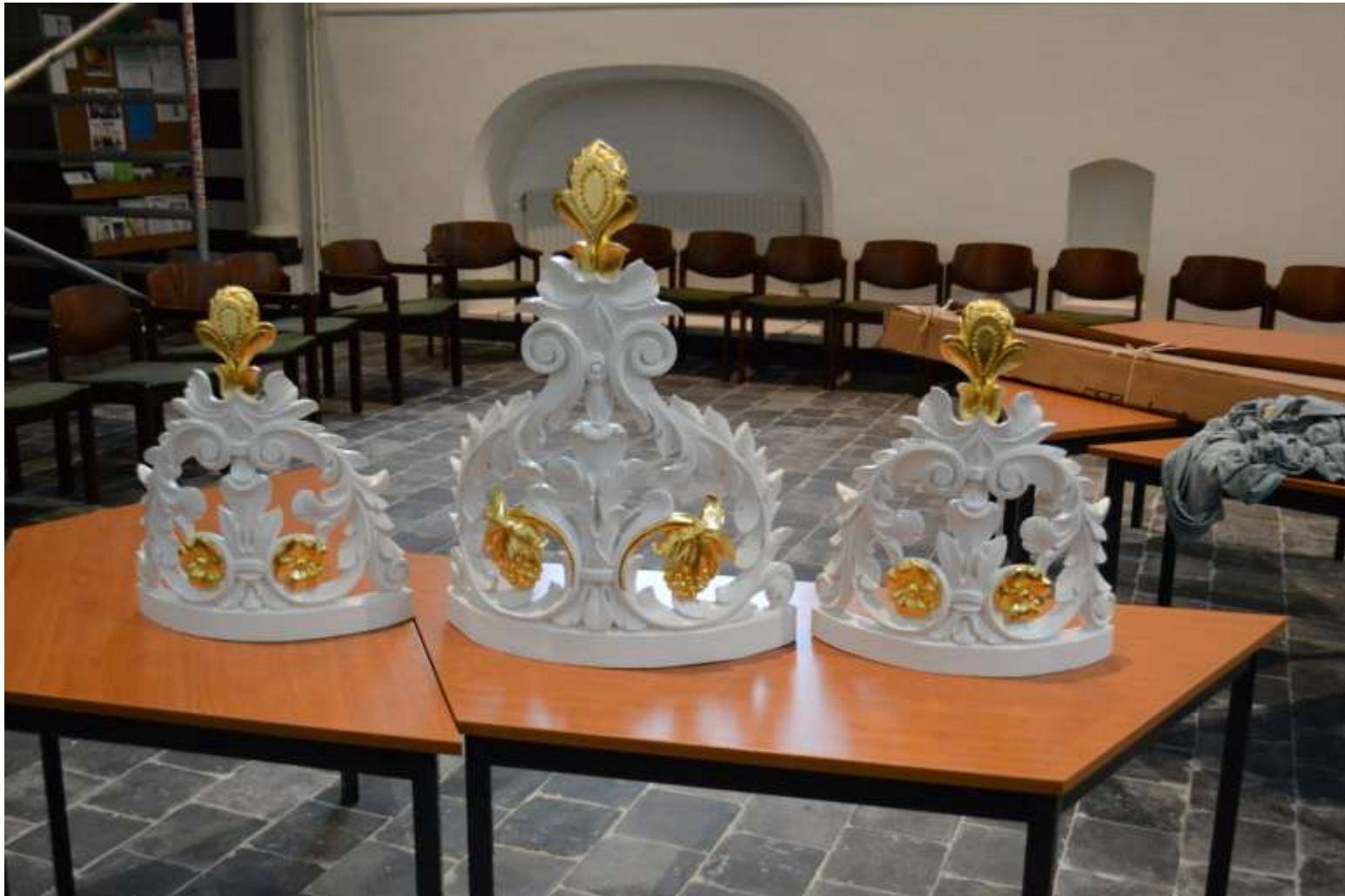
De drie kuiven in volle glorie gereed om teruggeplaatst te worden. Let op de opnieuw aangebrachte top op de middelste kuif.