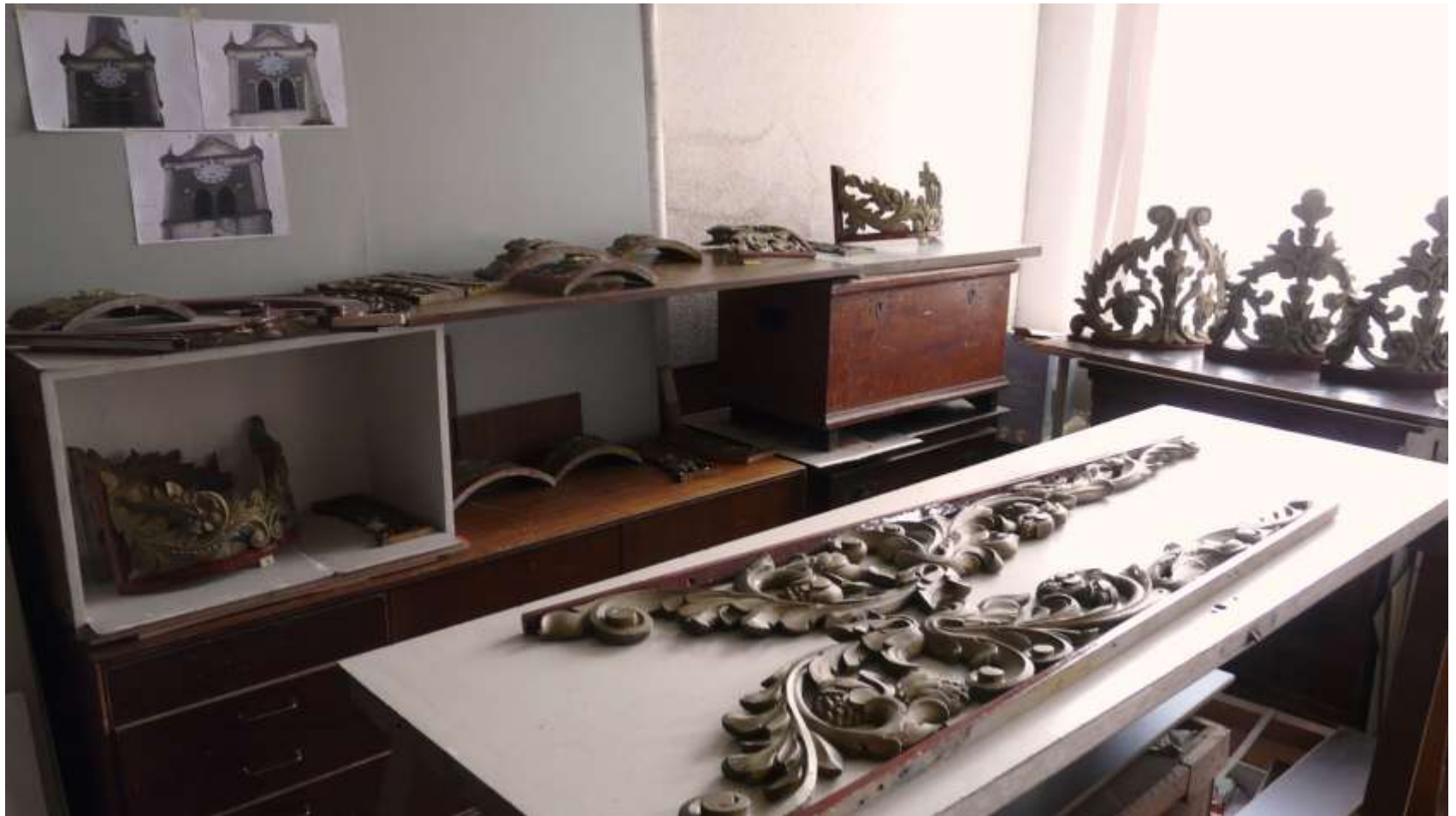
Burdaard : De afgenomen en gerepareerde delen van het snijwerk voor de metamorfose.