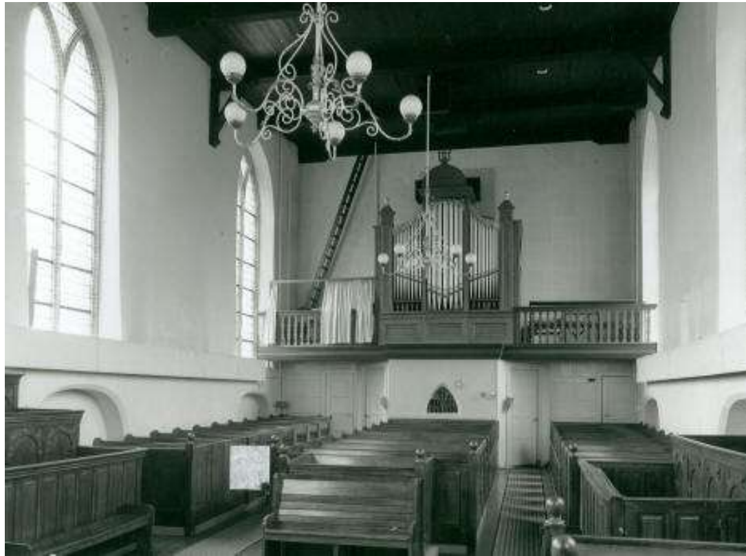
Het Stoker orgel 1908 tot 1983