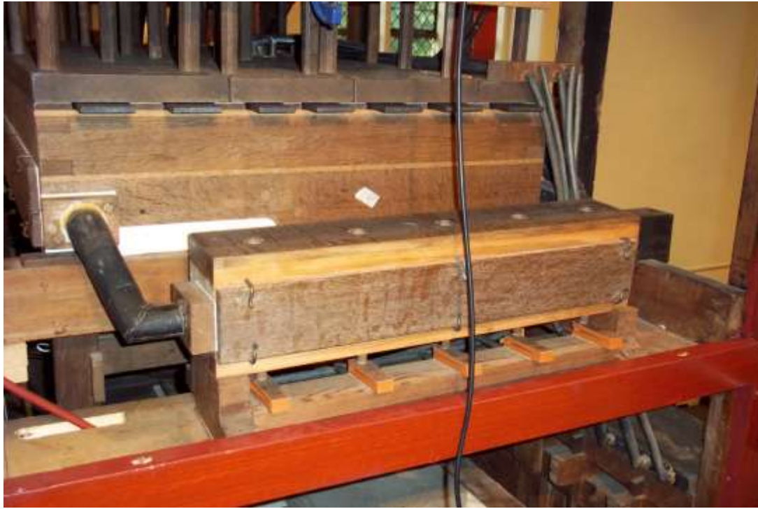
Op z'n plaats in het orgel